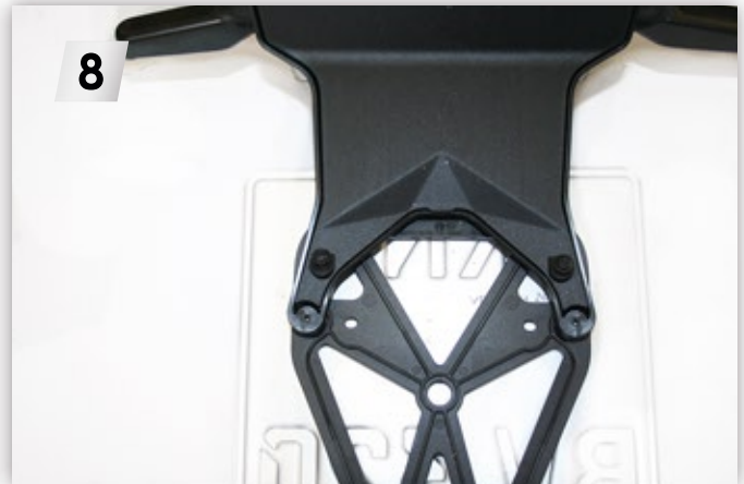
8 Abdeckung abnehmen (2 x „Torx T20“) Remove cover (2 x "Torx T20")