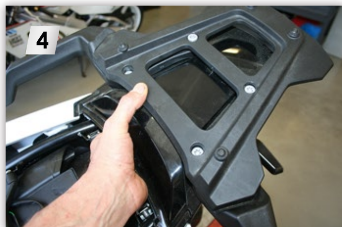
4 x „Torx T45“ lösen und Gepäckbrücke inkl. Abdeckung abnehmen Loosen 4 x "Torx T45" and remove luggage rack including cover