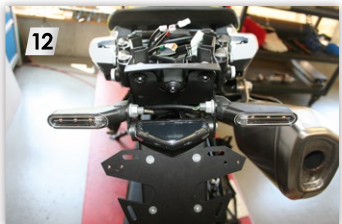
12 Abdeckplatte mit originalen Schrauben, „M6“ Scheibe und Mutter montieren („T20“ / „SW10“); Stecker anschließen Mount the cover plate with the original screws, "M6" washer and nut ("T20" / "SW10"); Connect the plug