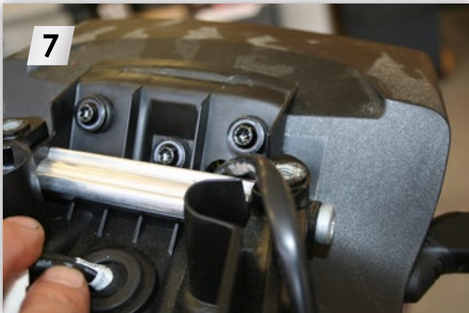
7 Rücklicht lösen, Originalkennzeichenträger abnehmen, Kabel ziehen (3 x „Torx T27“) Loosen the rear light, remove the original license plate holder, pull out the cable (3 x "Torx T27")