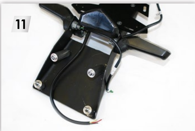
11 Kabel durchführen; Träger mit Buchsen und „M6“ Schrauben unten am Heck montieren Pass the cable through; Mount the license plate holder with sockets and "M6" screws at the bottom of the rear end