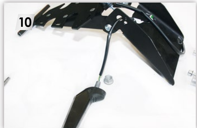
10 Blinker an MIZU Träger montieren Mount turn signals onto MIZU holder