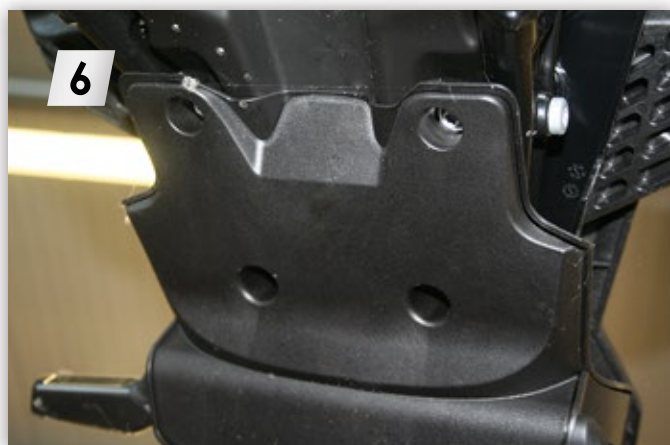
Heckschrauben unten lösen (4 x „Torx T27“) Loosen the rear bottom screws (4 x "Torx T27")