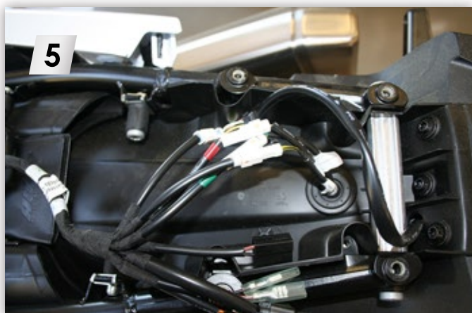
Stecker ziehen (4 x) Pull out the plug (4 x)