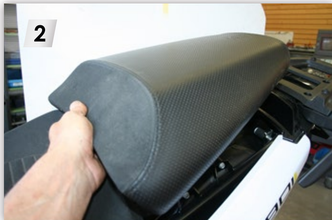
Soziussitz mit Schlüssel entriegeln und abnehmen Unlock with key and remove the passenger seat