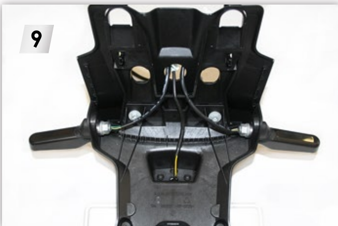
9 Blinker demontieren („SW13“) Dismantle turn signals ("SW13")