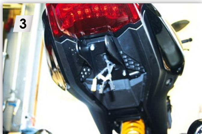
3 Unten Originalheck demontieren. Disassemble the original rear below.