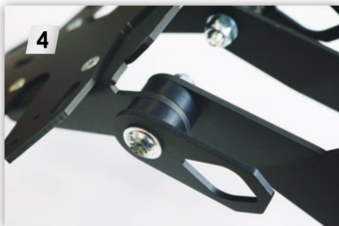
4 Blinkerhalter mit Kennzeichenhalter verbinden. Beiliegende Hülsen und Schrauben verwenden. Connect turn signal holder with license plate holder. Use enclosed hulls and screws.