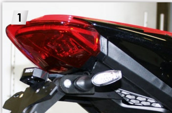
1 Soziussitz abnehmen. Remove passenger seat.