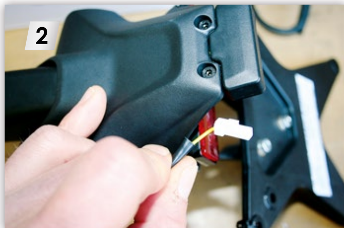
2 Stecker ziehen. Pull the plug.