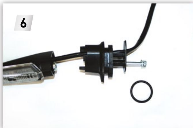
6 Heck und Blinker montieren. O-Ringe vom origi- nalen Blinker zum Distanzausgleich verwenden. Mount the rear and turn signals. Use original O-rings for distance adjustment.