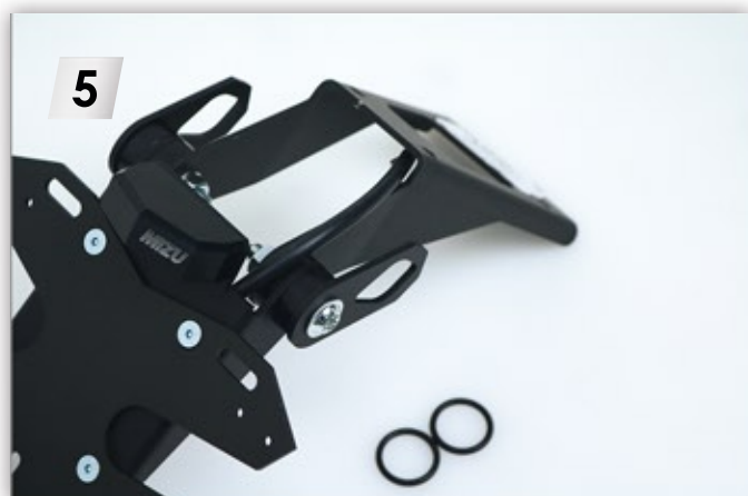
5 MIZU Heck zur Montage fertig vorbereiten. Prepare MIZU rear ready for mounting.